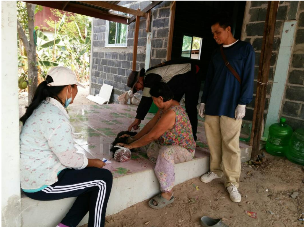
หมู่ที่ ๑-๙ ตำบลโพนสูงอำเภอปทุมรัตต์จังหวัดร้อยเอ็ด ระหว่างวันที่ ๒๓-๒๖ มีนาคม ๒๕๖๔ โดย เทศบาลตำบลโพนสูง อำเภอปทุมรัตต์จังหวัดร้อยเอ็ด