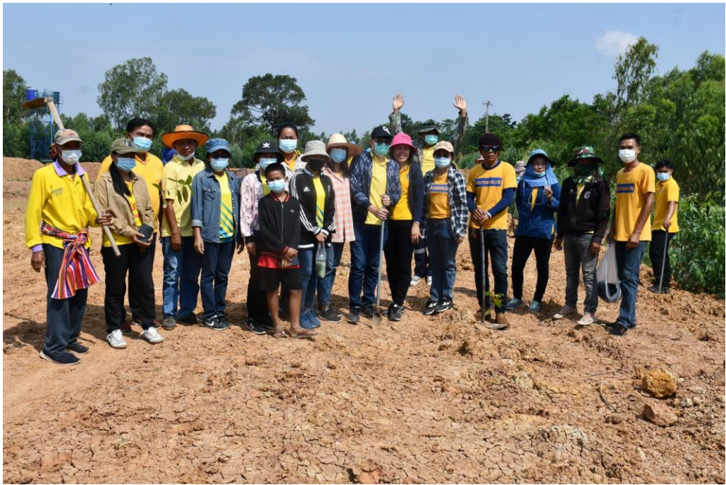
ภาพถ่ายการดำเนินงานโครงการปลูกป่าเฉลิมพระเกียรติ ประจำปี ๒๕๖๔ วันพฤหัสบดีที่ ๑๓ พฤษภาคม ๒๕๖๔ ณ บริเวณพื้นที่รอบหนองป่าช้าสาธารณประโยชน์ บ.โพธิ์น้อย ม.๖ ต.โพนสูง อ.ปทุมรัตต์ จ.ร้อยเอ็ด