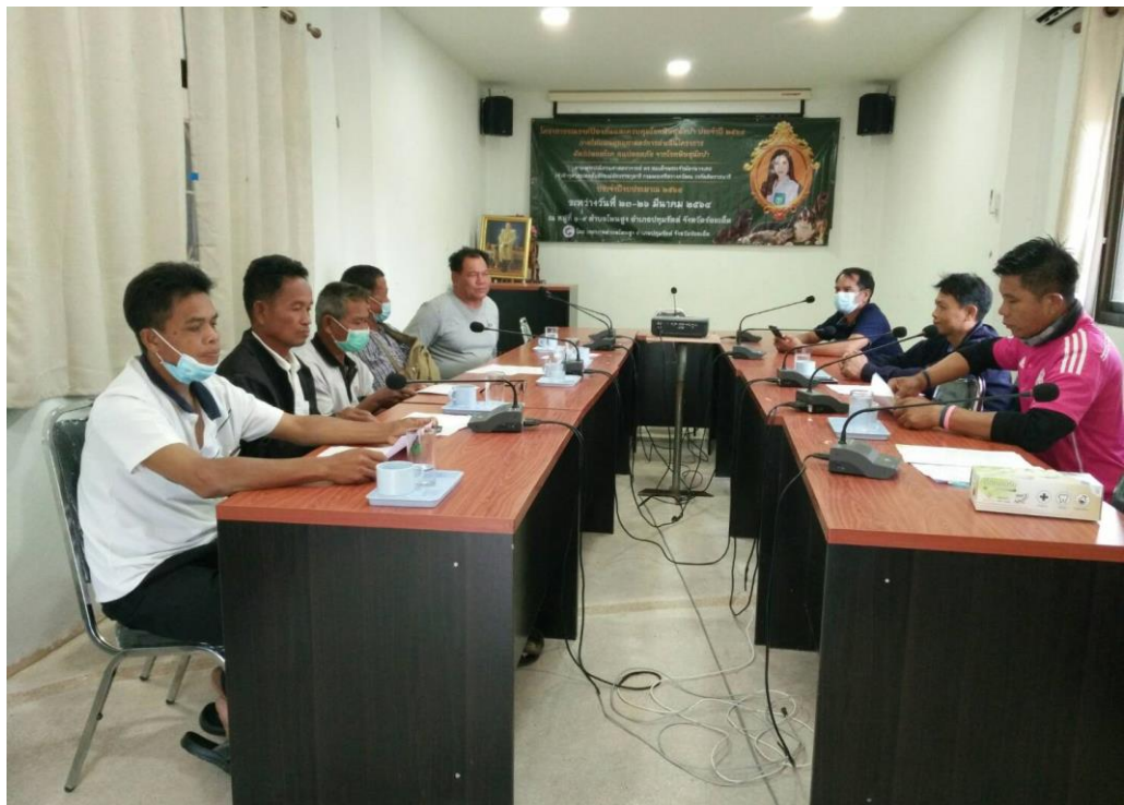
ถ่ายภาพดำเนินงานโครงการปลูกป่าเฉลิมพระเกียรติ ประจำปี ๒๕๖๔ วันพฤหัสบดีที่ ๑๓ พฤษภาคม ๒๕๖๔ ณ บริเวณพื้นที่รอบหนองป่าช้าสาธารณประโยชน์ บ.โพธิ์น้อย ม.๖ ต.โพนสูง อ.ปทุมรัตน์ จ.ร้อยเอ็ด