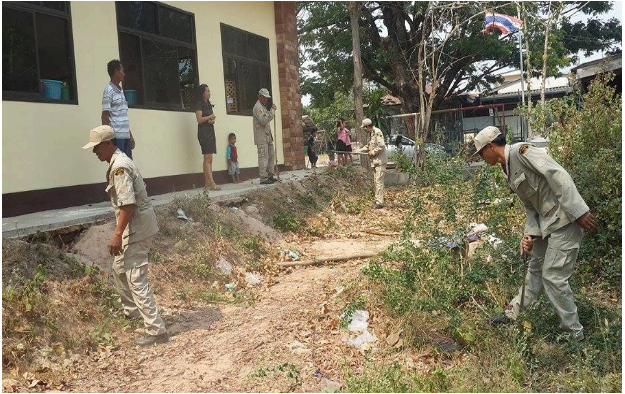
ครูภัณฑ์