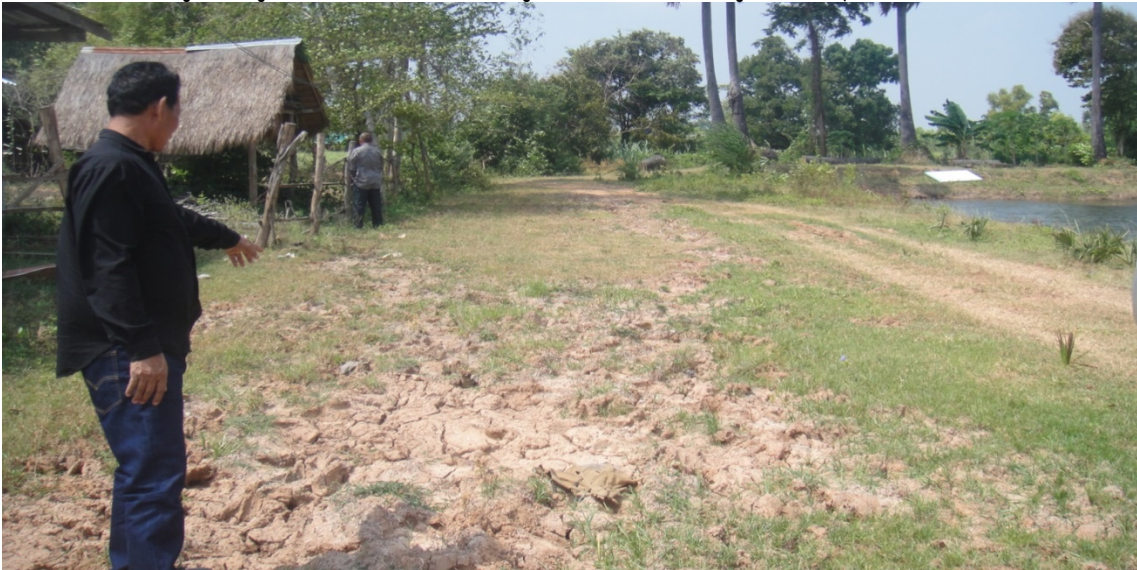
รูปภาพขณะดำเนินงานโครงการซ่อมแซมถนนลูกรังพร้อมปรับเกลี่ย