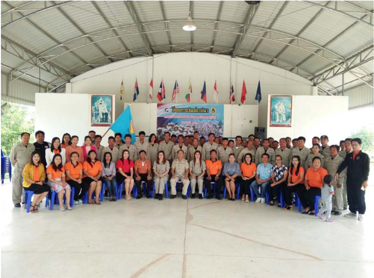
ภาพประกอบโครงการวันสถาปนาอาสาสมัครป้องกันภัยฝ่ายพลเรือนแห่งชาติ ประจำปี พ.ศ.๒๕๖๑