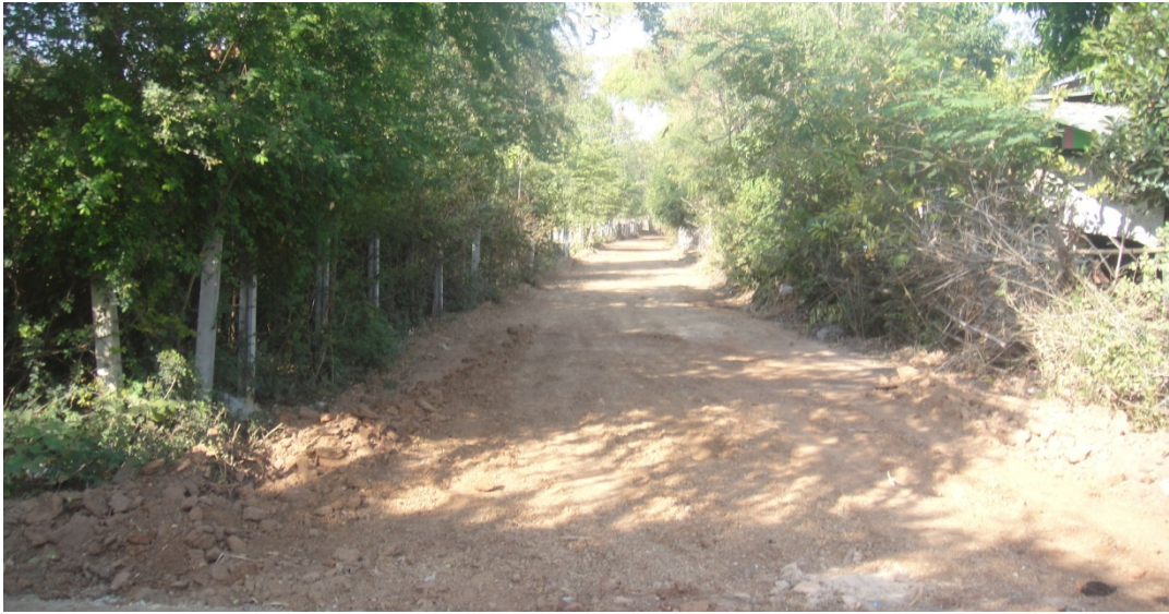
รูปภาพขณะดำเนินงานโครงการก่อสร้างถนน คสล.