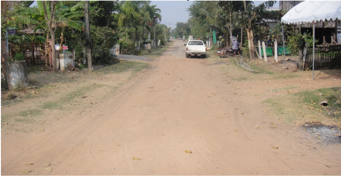
รูปภาพขณะดำเนินงานโครงการก่อสร้างถนน คสล.