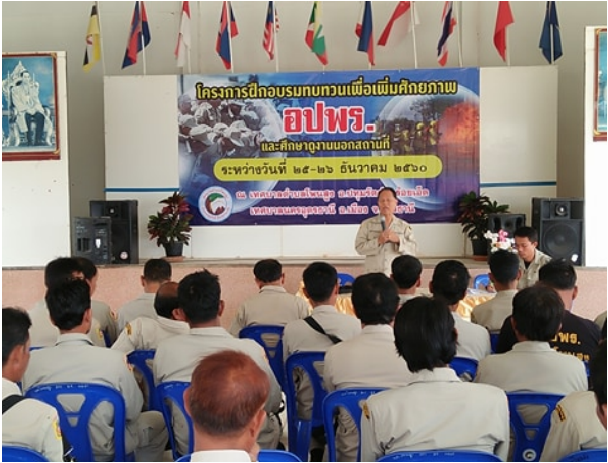
โครงการป้องกันและลดอุบัติเหตุทางถนนในช่วงเทศกาลปีใหม่ 2561