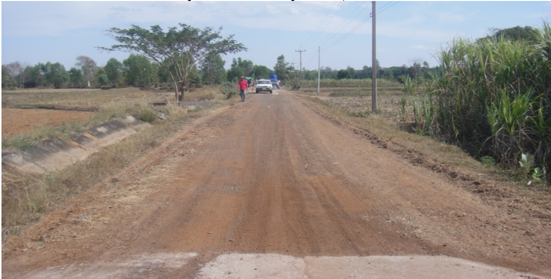
รูปภาพขณะดำเนินงานโครงการก่อสร้างถนน คสล.